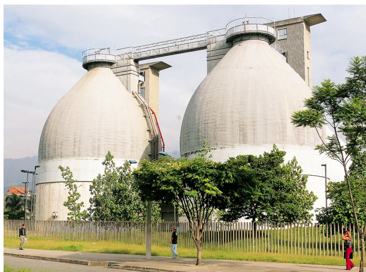
El aporte de la planta de San Fernando, que opera desde 1999, es fundamental en la recuperación de las aguas del río Medellín.

Removerá aproximadamente 140 toneladas diarias de contaminación, lo que hace que el río tome nueva-