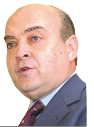
DOMINGO CAVALLO Ex ministro de Economía de Argentina

organismos, porque es precisamente en circunstancias como éstas, en las que la asistencia financiera de los organismos cobra su máximo sentido. Los países con economías emergentes que hoy prácticamente no tienen crédito público, como es el caso de Ecuador, Argentina y Venezuela, debían asignar primerísima prioridad a ponerse en condiciones de ser elegibles para la asistencia financiera del FMI, porque son los que más la necesitarán. Después de haber perdido el crédito público a consecuencia del manejo económico del pasado, es impensable que puedan recuperarlo si previamente no demuestran que son capaces de conseguir la asistencia de los Organismos Multilaterales de Crédito. Lamentablemente ninguno de los tres está enviando señales que indiquen que quieren seguir este camino. Ojalá la próxima reunión del BID, en Medellín, ayude a que los dirigentes de estos tres países adviertan el callejón sin salida al que están llevando a sus respectivas economías y se apresuren a cambiar de rumbo.